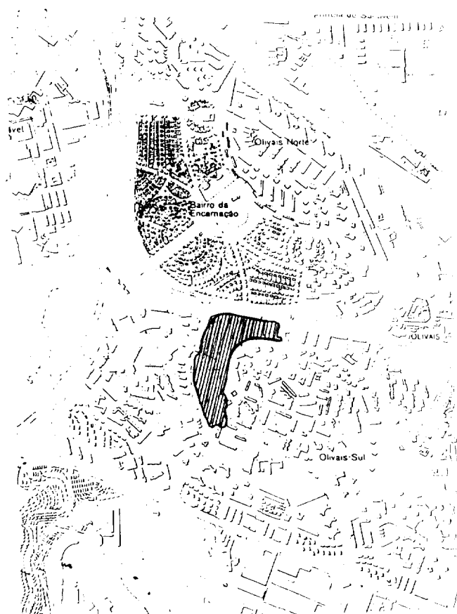
-Parque de Olivais Sul (com 8 ha)