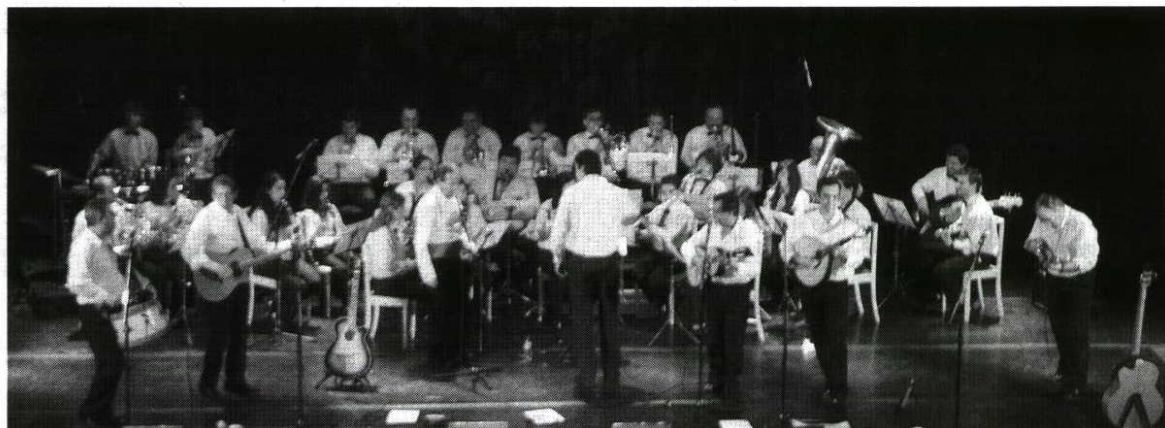
► O Conjunto António Mafra partilhou o palco do Casino Figueira com a filarmónica da Sociedade Boa União Alhadense

Os 13 dias do evento «Vinhos de Portugal 2011», que decorreu no Casino Figueira de 28 de Outubro a 13 de Novembro, chegaram ao fim com um jantar vínico regado com os melhores vinhos de «Concurso de Vinhos de Lisboa 2011» e animado pelas histórias e curiosidades de Vasco Avillez, ex-presidente da Viniportugal e presidente da CVR Lisboa. Para trás ficava uma semana recheada com outras iniciativas sob a égide de Baco.