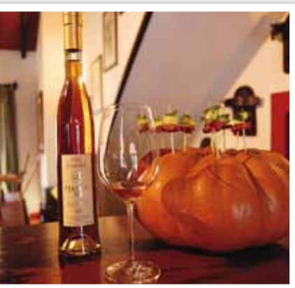
L'AOC LOURINHÃ, eau-de-vie de vin, présente une belle robe ambrée.

Après le cognac et l'armagnac, le lourinhã au Portugal est la troisième eau-de-vie de vin AOC en Europe. Un produit rare que seules deux entreprises perpétuent.