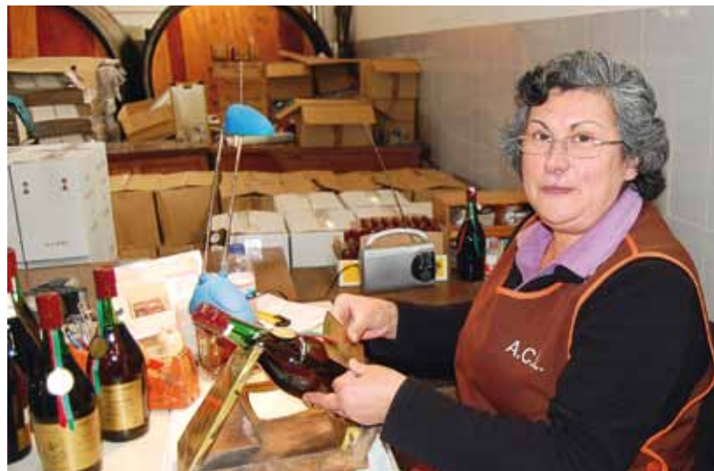
À LA CAVE COOPÉRATIVE de Lourinhã, l'étiquetage des bouteilles XO, la catégorie des eaux-de-vie de plus de 5 ans d'âge, se fait manuellement.

Le vieillissement est le secret d'une bonne eau-de-vie , à Quinta do Rol comme à la cave coopérative. « Nos barriques sont en chêne français et portugais, et aussi en châtaignier. La "part des anges", en raison de notre climat, est de 5 % par an les deux premières années, puis de 2 % seulement les années suivantes. À la fin du vieillissement, l'ajout d'eau