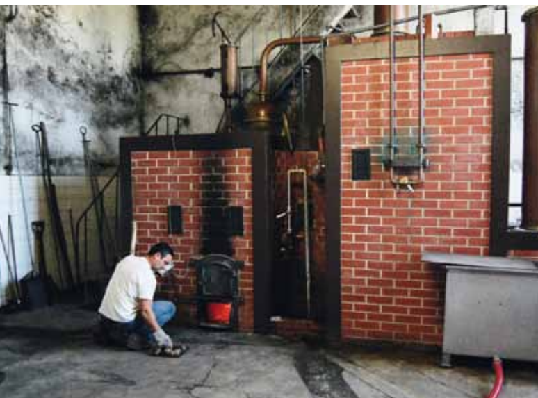
LES ALAMBICS DE QUINTA DO ROL sont chauffés grâce à un four à bois, maintenu à la température constante.